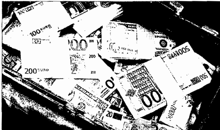
Billetes de distintas monedas.

El trasiego de billetes de 500 en España no es anecdótico. El 26%